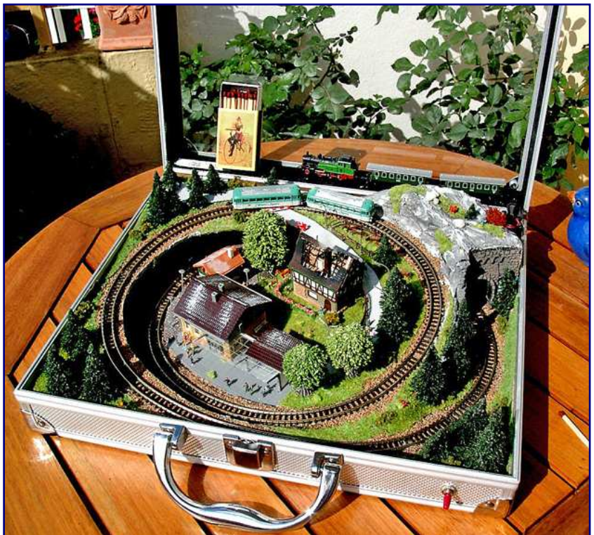
Ein ungenutztes Kofferchen bot Platz für eine kleine Anlage. Anregungen für die Gestaltung bot unserem Leser auch die Lektüre von Trainini® .