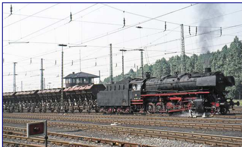
Ebenfalls eine Aufnahme mit Reiz für die Modellbahn: 044 596-5 passiert am 26. Juni 1975 mit dem Kieszug Gdg 57979 die Südausfahrt des Rangierbahnhofs Gremberg.

Im Raum Ottbergen und Bad Driburg führte der Weg der Lokomotiven vor schweren, gemischten Güterzügen auch über das berühmte Eisenbahnviadukt von Altenbeken.