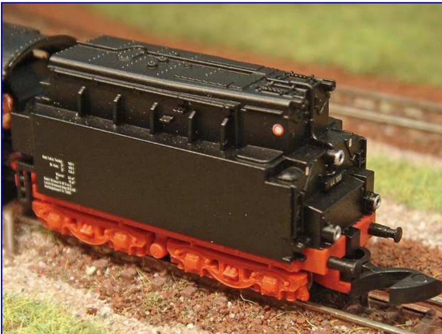
Bild oben: Die plastische Struktur der Tenderkohle ist verloren, die Stücke wirken zu flach und deutlich größer als früher. Eine Überarbeitung der Formen scheint dringend angeraten.

Bild unten: Deutlich besser sieht der Öltender aus, auch wenn wenige Details feiner graviert sein dürften. Der Aufdruck auf die Lampenringe lässt die Laternen fein wirken. Eine vollständige Bedruckung rundet seine Wirkung ab.