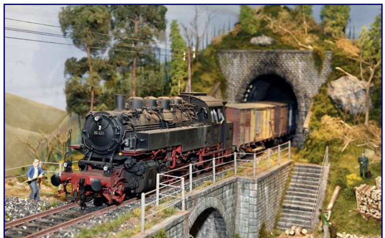
Eine Intermodellbau-Impression aus den vergangenen Jahren in einer größeren Spurweite zeigt diese Aufnahme.

Auf ihrer Anlage werden wichtige Sequenzen für das Trainini Jahresvideo 2010 gedreht, das sich hauptsächlich mit dem diesjährigen Jubiläum der deutschen Eisenbahnen befassen wird.