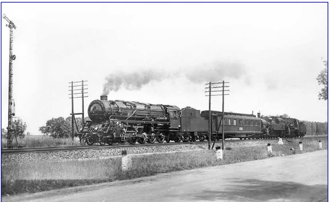
Sonderlinge innerhalb der Baureihe 44 waren die beiden Mitteldrucklokomotiven für 25 atü Kesseldruck, mit denen die Deutsche Reichsbahn Versuche anstellte, um die Wirtschaftlichkeit der Dampflokomotive zu steigern. Am 11. Juli 1933 ist die neue 44 012 mit einem Messwagen der LVA Grunewald sowie den Bremslokomotiven 94 1301 und 56 113 bei Brandenburg unterwegs. Nach dem Krieg gelangte sie zur VES-M Halle und erhielt eine Riggenbach-Gegendruckbremse.