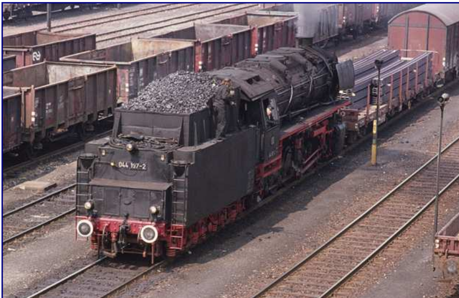
Der große Kessel des Jumbos verschlang sehr viel Kohle. Daher wurden auf den Kohletendern, wie hier auf dem der 044 197-2, häufig Erhöhungen angebracht, mit denen die Ladekapazität erhöht werden sollte.

die von der Raffinerie in Salzbergen, nur wenige Kilometer von Rheine entfernt, ausgehen. Das endgültige Ende der Dampflok wurde 1975 absehbar.