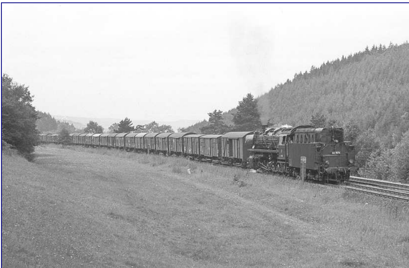
Zwei Aufnahmen aus der Glanzzeit der Baureihe 44, die zur Nachbildung im Modell einladen: 44 218 mit Schürze durchfährt aus Emden kommend, Ende der sechziger Jahre mit einem Erzzug in südlicher Richtung die Bahnhofseinfahrt von Rheine (Bild oben). Die Aufnahme entstand von der Überführung an der Neuenkirchener Straße. 44 1574 ist rückwärts fahrend mit einem Gannzug aus gedeckten Wagen unterwegs (Bild unten).