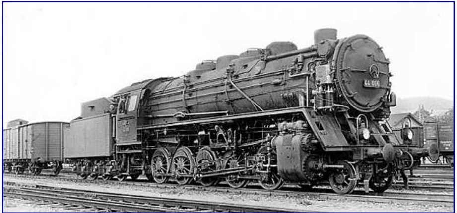
44 006 gehörte zu den ersten 10 Lokomotiven, die 1926 zu Vergleichszwecken gebaut wurden. Diese Maschinen trugen noch keine Windleitbleche, wohl aber eine Frontschürze. Zu sehen ist die Lok 1930 im Bahnhof Pressig-Rothenkirchen an der Frankwaldbahn.

In den Kriegsjahren ab 1941 stiegen die Beschaffungszahlen deutlich an, weil die Reihe als kriegswichtig eingestuft wurde.