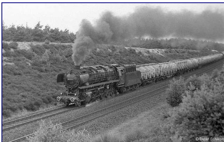
Bild links oben: Auch die Moselbahn gehörte zu ihren Einsatzgebieten. 044 523-9 fährt am 23. Mai 1971 bei Pünderich auf das Hangviadukt zu.

Auch in Osnabrück wurden sie mit der Elektrifizierung der Rollbahn in Richtung Hamburg überflüssig.