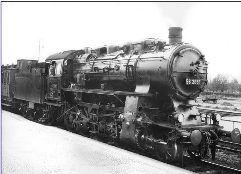
Bis weit in die dreißiger Jahre trugen Länderbahnmaschinen die Hauptlast des schweren Güterverkehrs. Teilweise wurden sie dafür durch nachträgliche Ausrüstung mit Vorlaufachsen ertüchtigt. 1935 absolvierte 56 2891 auf der Strecke Ludwigslust – Wittenberge Indusi-Erprobungsfahrten.

Diese Probleme führten schließlich zu einem Stimmungsumschwung, der die Baureihe 44 in ein neues Licht rückte. Im oberen Leistungs-