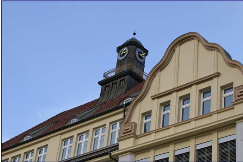
Das Musterzimmer im Uhrenturm gilt als Ort vieler Märklin-Schätze aus allen Zeiten der Produktion dieser Firma.

Den Einlass erreicht, stellten wir leider fest, dass Fotografieren im Firmengebäude nicht gestattet war – keine optimalen Voraussetzungen für einen Bericht, aber nicht zu ändern. Wir erhielten ein Faltblatt, das uns auf den Rundgang vorbereitete: Wir würden den gesamten Prozess der Entstehung eines Lokmodells in weitgehend chronologischer Reihenfolge erleben können. Nur die Phase der Vorarbeiten per CAD-Konstruktion war losgelöst davon am Ende vorgesehen.