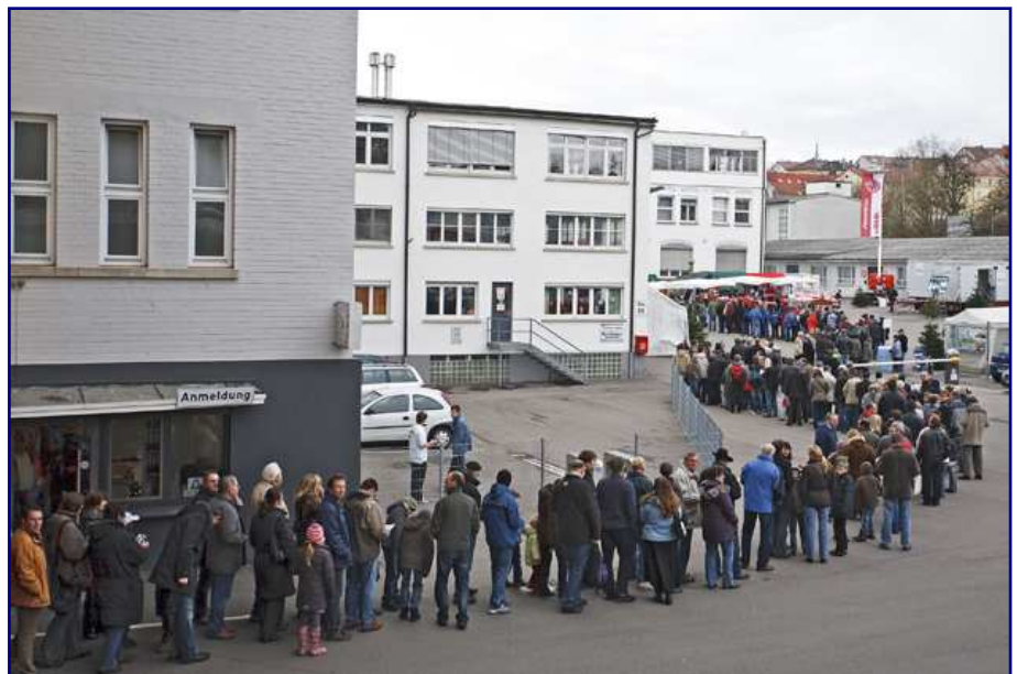
Wer immer die Zeit fand, wollte sich die vielleicht einmalige Gelegenheit nicht entgehen lassen. Und so bildete sich bald eine mehrere hundert Meter lange Menschenschlange vor dem Einlass zur Werksbesichtigung.

Auf den ersten Blick relativ unspektakulär erschien die Abteilung Galvanik. Statt auf bewegte Maschinen schaute der