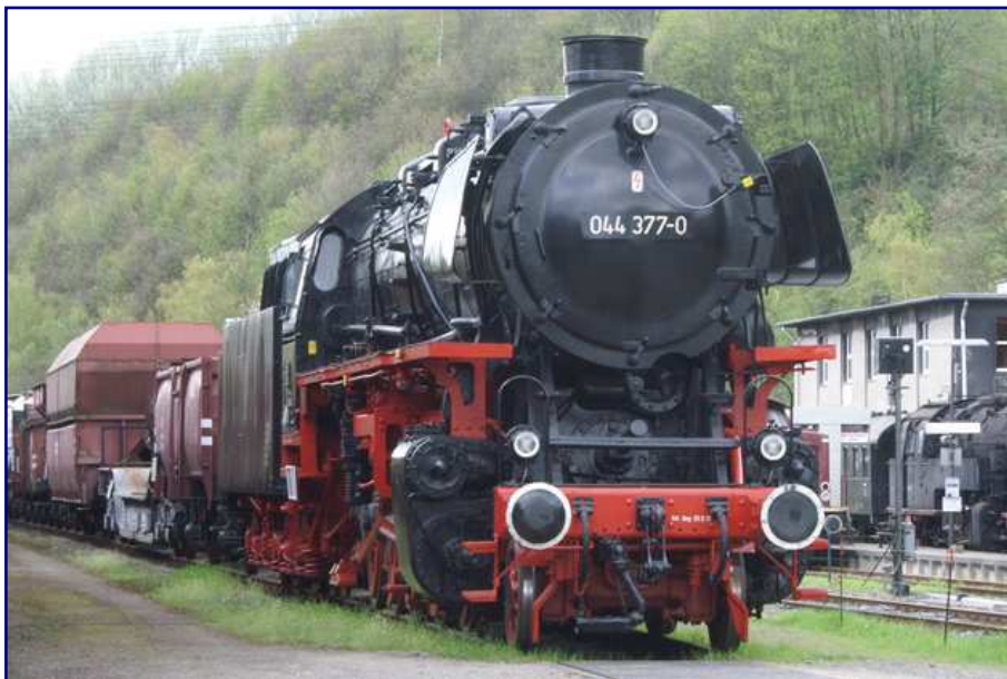
Stellvertretend für die erhaltenen Lokomotiven der Baureihe 44 zeigen wir die 044 377-0. Sie ist heute im Eisenbahnmuseum Bochum-Dahlhausen zu Hause und zeigt sich in einem guten Zustand.

Es ist die 043 196-5, heute als Denkmal am Bahnhof von Salzbergen aufgestellt, die häufig mit Sonderfahrten unterwegs war und sich daher bis zum letzten Tag gepflegt und gut im Lack zeigt.