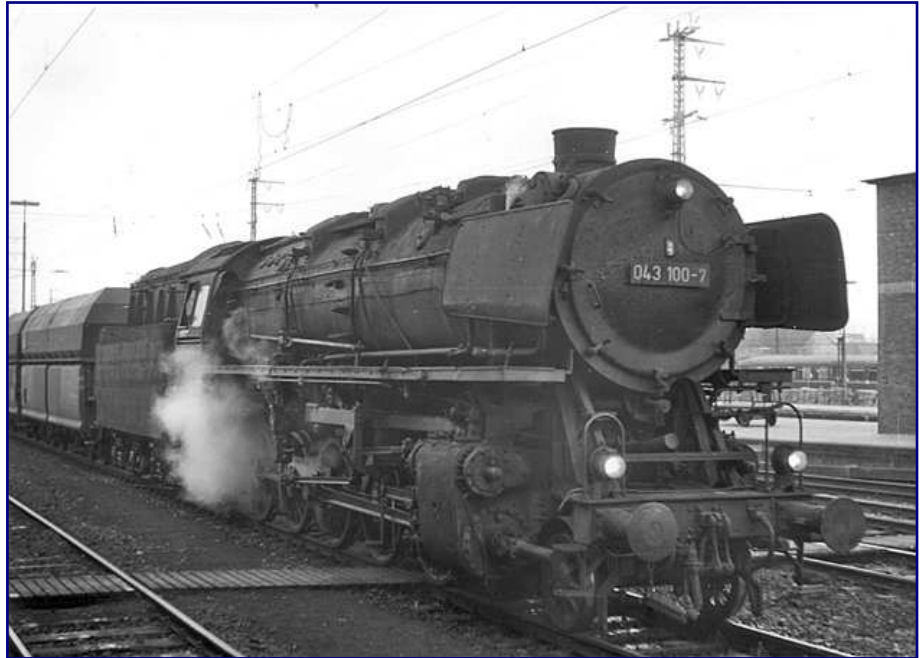
Märklins Modellvorlage war die 44 100, ab 1968 als 043 100-7 bezeichnet. Auch sie fand im Bw Rheine R ihre letzte Heimat.

Ursprünglich sollte der Dampfbetrieb bei der Bundesbahn 1974 enden, so dass der Umbau von drei weiteren Lokomotiven auf Ölhauptfeuerung im gleichen Jahr zunächst überrascht.