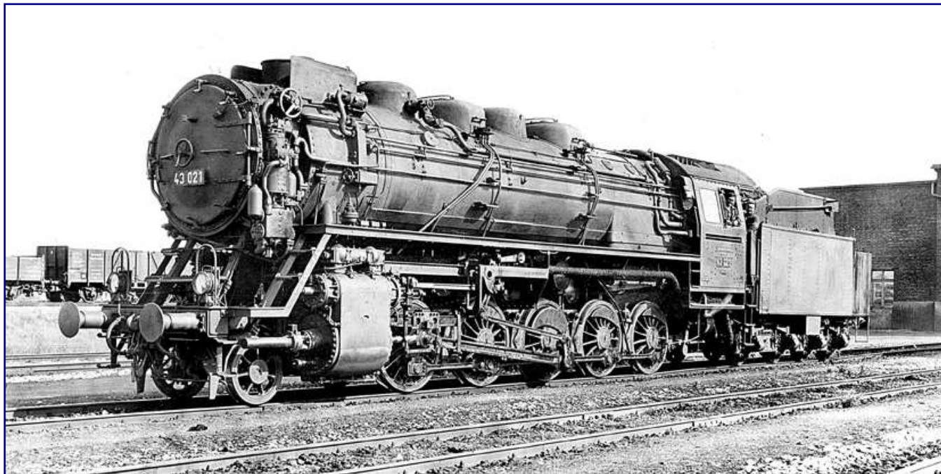
Am 16.3.1934 zeigt sich 43 021 im Bw Chemnitz-Hilbersdorf mit „kleinen Ohren“: Versuchsweise rüstete die Deutsche Reichsbahn verschiedene Dampflokomotiven mit abweichenden Windleitblech-Bauarten aus, um den besten Kompromiss zwischen Wirkung und Streckensicht zu finden. Ausgerüstet ist die zweizylindrige Schwesterbauart der 44 mit einem Niettender 2'2 T32. Schon bald hatte diese Baureihe gegenüber der BR 44 wegen ihrer geringeren Leistung und Höchstgeschwindigkeit das Nachsehen.

Erst 1932 stiegen die Transportleistungen wieder an und auch die Konkurrenz durch den LKW bekam die Deutsche Reichsbahn-Gesellschaft langsam zu spüren. Damit stieg der Bedarf an schnelleren Lokomotiven. Die Baureihe 43 war für 70 km/h Höchstgeschwindigkeit zugelassen, die vielen älteren Fahrzeuge lagen deutlich darunter und konnten nur durch nachträglichen Einbau von Vorlaufachsen weiter ertüchtigt werden.