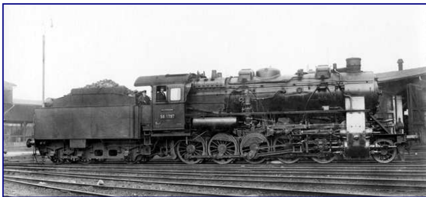
Als die Einheitslokomotiven entwickelt wurden, lagen bereits Erfahrungen mit fünffach gekuppelten Maschinen wie der 58 1797 vom Bw Leipzig-Engelsdorf vor. 1937 wurde die Drillingslok in ihrer Heimatdienststelle fotografiert.

Schon bald nach ihrer Gründung strebte die Deutsche Reichsbahn-Gesellschaft nach einer Vereinheitlichung ihres Fahrzeugparks. Auslöser dieser Entwicklung waren gestiegene Anforderungen aufgrund steigender Zuglasten sowie das Bemühen um eine wirtschaftlichere Wartung und Reparatur durch Vorhaltung standardisierter und einheitlicher Bauteile. Das Ergebnis dieser Anstrengungen waren die so genannten Einheitslokomotiven.