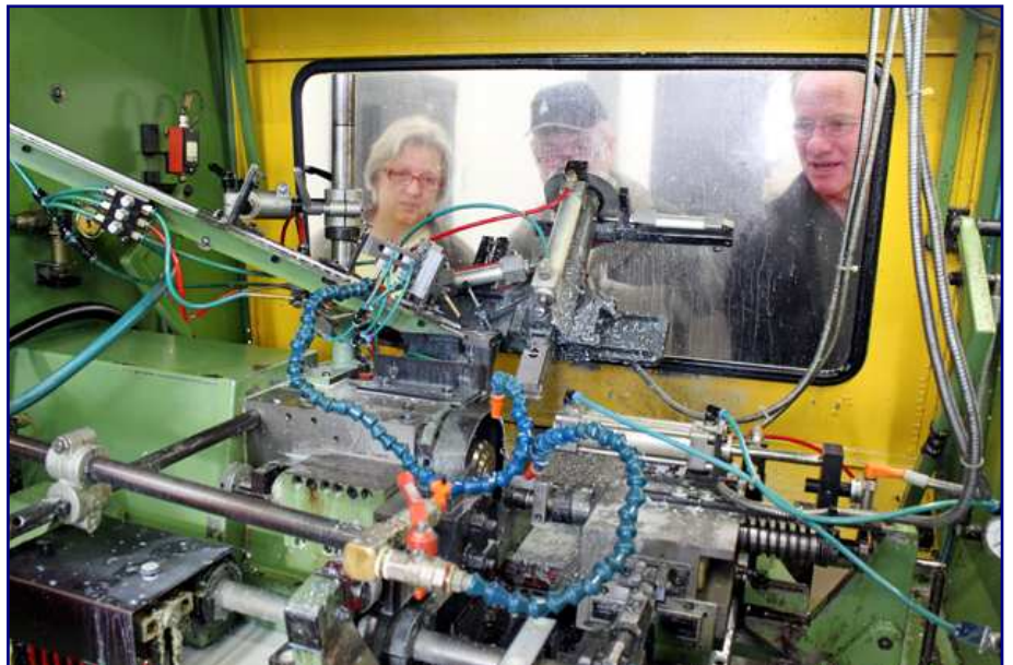
Die Guss-Nachbearbeitung, zu der Entgraten, Fräsen und Bohren gehören, läuft hoch automatisiert ab. Sogar Roboter kommen zum Einsatz.

Ein solcher Überzug kann dekorative, z.B. ein anderes Aussehen, oder funktionale Gründe, z.B. Schutz vor Korrosion oder Verbesserung der elektrischen Leitfähigkeit, haben.