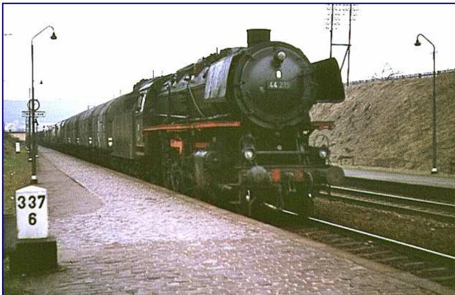
Ein ungewöhnlicher Einsatz, der sich auch in der Spurweite Z nachbilden lässt: 44 215 ist am 28. Januar 1967 laut polternd mit vier der von 1960 Credé gebauten Großraum-Kesselwagen für das schwere Bunkeröl Klasse C, mit dem die ölgefeuerten Maschinen beheizt wurden, in Obervellmar unterwegs.

Trotz der Eindrücke der ersten Ölkrise ließ die DB 1973/74 noch einmal drei Exemplare auf Ölhauptfeuerung umbauen, darunter die letzte aktive Lok des Bw Rheine – die 043 196-5.