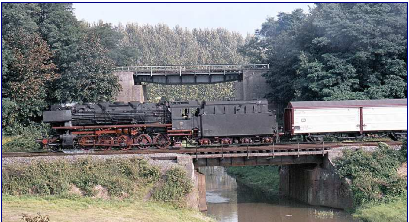
Einen interessanten, gemischten Güterzug befördert 044 247-5 durch das Fichtelgebirge (Bild oben). Er reizt zur Nachbildung im Modell. Die ölgefeuerte 043 574-2 (ex 44 1574) überquert am 14. September 1974 mit dem VW-Zug Dg 65661 die Raddebrücke bei Meppen. Das fehlende, vordere Führerstandsseitenfenster beweist ihren Bau als Kriegslokomotive.