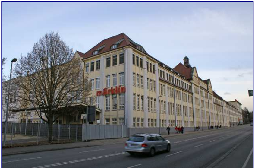
Am 4. und 5. Dezember 2010 bot Märklin im Rahmen veranstaltete Märklin einen Tag der offenen Tür. Erstmals gab es zu diesem Anlass die Gelegenheit zu einer Besichtigung des Stammwerks, bezeichnet als Werk 1.

Eine halbe Stunde Warten versüßten wir uns mit einem Frühstück und warmen, alkoholfreien Getränken, denn auch die gab es auf dem Hof reichlich, weil Märklin begleitend den 1. Märklin-Christkindles-Markt aufgebaut hatte und sichtlich mit einem großen Besucherstrom gerechnet hatte. Hinter uns wurde die Schlange derweil immer länger und wir freuten uns, dass wir so früh angekommen waren.