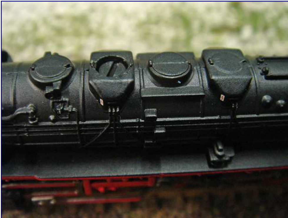
Die Gehäuseschraube sitzt, wie gewohnt, versteckt in einem der Sanddome. Feine Kesselgravuren zeichnen die neuen Modelle aus. Überzeugend wirkt auch der Aufdruck der rot-weißen Blitzwarnschilder. Die Pumpe auf dem Umlauf ist am Gehäuse angegossen.

Schauen wir als nächstes von oben auf die neuen Modelle: Der Kessel ist (rundherum) gut graviert. Alle Leitungen, die Sandfallrohre im oberen Bereich, die beiden Sicherheitsventile und die Dampfentnahmestutzen sind nachgebildet worden. Die Turbolichtmaschine links neben dem Schornstein sowie die Luft- und Speisepumpen fehlen nicht.