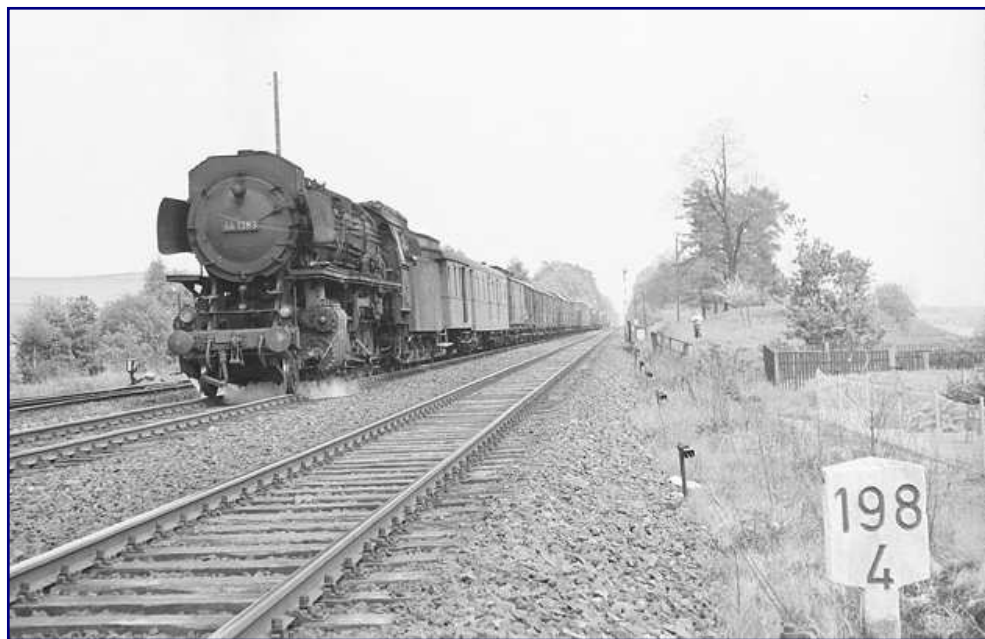
44 1383 gehörte zu den DB-Lokomotiven, die versuchsweise mit Mischvorwärmern ausgestattet wurden. Als einzige dieser Lokomotiven erhielt sie einen Knorr-Mischvorwärmer mit zweistufiger Kolbenpumpe, der im Versuch zu den größten Brennstoffersparnissen führte. Alle anderen Maschinen erhielten die Bauart Henschel mit Turbospeisepumpe.

Bei den meisten Lokomotiven entfernte die DB die Frontschürzen und gab ihnen so ein moderneres Aussehen. Die vielen weiteren Bauartänderungen wie das Verlegen der Pumpen sollen hier nicht im Detail besprochen werden. Auf einen versuchsweisen Umbau möchten wir aber hinweisen: