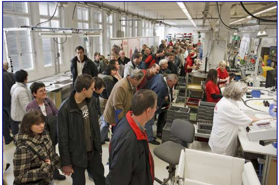
In der letzten Halle befanden sich Endmontage und Endkontrolle. Auf der Testanlage vorne rechts im Bild absolviert jedes Modell einige Runden, alle Funktionen werden überprüft. Erst danach gelangt es in die Verpackung.

Virtuell ließ sich nachverfolgen, wie es zu jedem einzelnen Schritt kam, der zuvor in der Produktion zu sehen war. Eine weitere Bildschirmanimation zeigte, wie die Gussform des Kessels mit flüssigem Zink gefüllt wird. Errechnet wurde hier, ob Temperaturveränderungen ausreichend hohe Fließfähigkeiten erlauben und der Guss alle noch so kleinen Details vollständig erreichen würde.