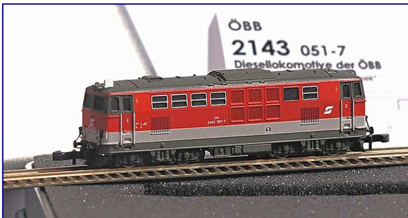
In drei Farbgebungen erscheint bei SMZ die Reihe 2143 der ÖBB. Das Modell der 2143 051-7 trägt das attraktive Valousek-Farbschema Verkehrsröt / Achatgrau / Umbragrau.

Durch den bewusst erzeugten Rummel erhielt die neue Diesellok der österreichischen Baureihe 2143 – Vorgängerin des „Herkules“ – die maximale Aufmerksamkeit.