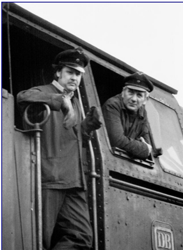
Der Dienst auf der Dampfloks war für die Personale harte Arbeit, bei der Kollegialität zählte.

Trainini: Ihre Liebe zur Dampfloks ist deutlich zu spüren. Ging es da allen Eisenbahnern so oder waren Ihre Kollegen auch froh, dass diese Ära zu Ende ging?