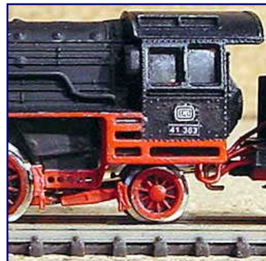
Während das DB-Emblem von Bahls stammt, hat Jens Wimmel die Loknummern selbst am PC gefertigt.

Was noch fehlt, sind eher Kleinigkeiten. So müssen die Witte-Windleitbleche aus bedruckbarer Kunststoff-Folie neu gebaut werden. Praktischerweise werden sie in einem Grafikprogramm gezeichnet, ausgedruckt und ausgeschnitten. Dem Vorbild entsprechend sind sie leicht zu biegen, bevor dann auch die Halter aus Messing nachgebaut werden, mit deren Hilfe die Bleche Halt am Kessel finden. Zwar lassen sich Windleitbleche auch als Märklin-Ersatzteile beziehen, aber der Eigenbau ist viel filigraner und ermöglicht eine stimmige Anordnung der Halter.