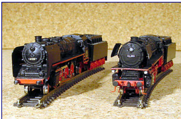
Die Gegenüberstellung eines Märklin-Modells 8827 mit der zur Baureihe 042 umgebauten Lok verdeutlicht den Umfang der Umbauarbeiten.

Nebenbei betreibt er das Internetangebot „ZettZeit“. Dort veröffentlicht er nicht nur seine Bastelvorschläge und die Reihe „Vorbild und Modell“, sondern betreibt auch die umfangreichste und aktuellste Linkliste für die Spurweite Z.