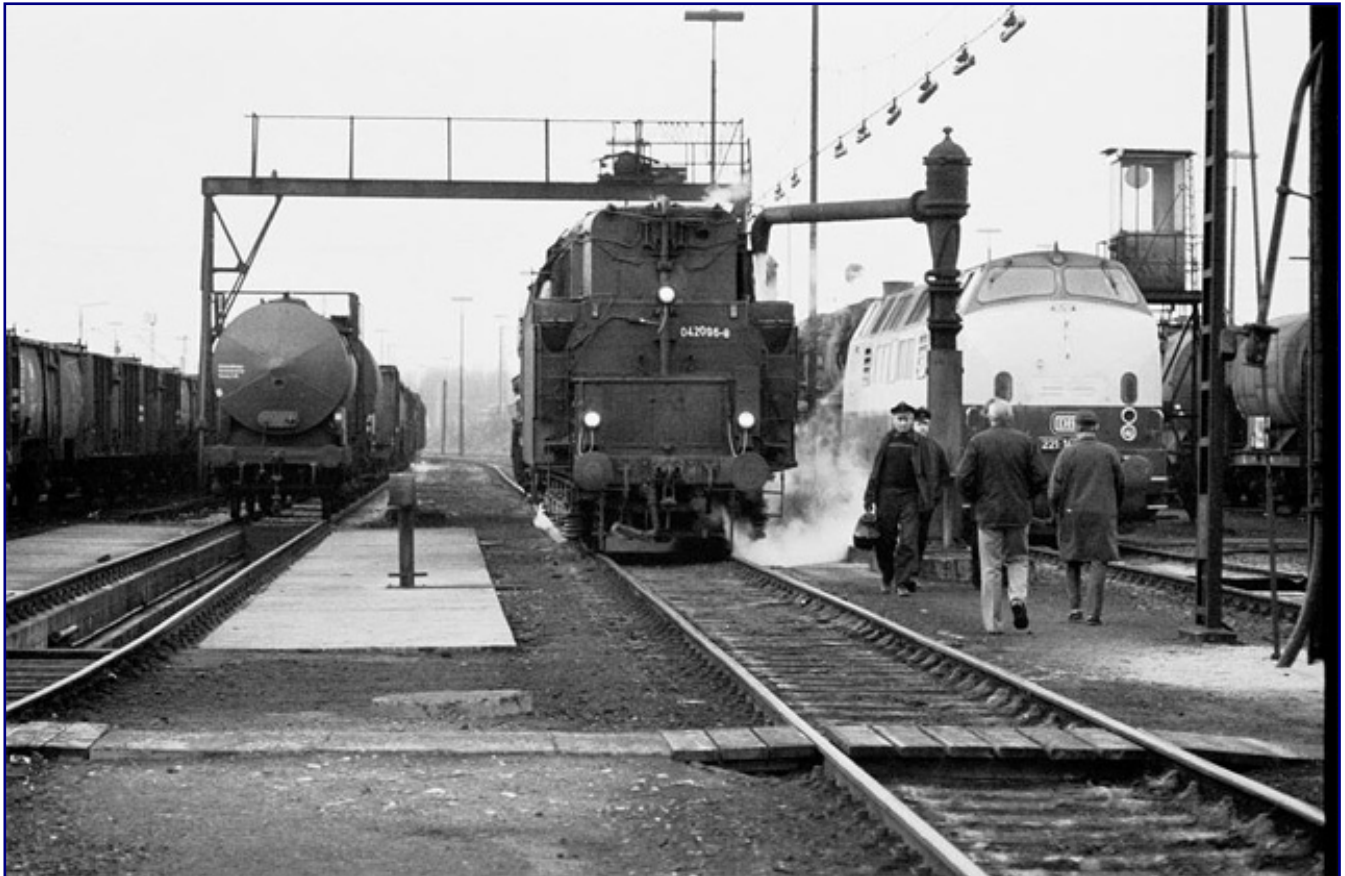
Der Umstieg von der Dampflokomotive auf Diesel- und elektrische Traktion schien dem Personal des Bw Rheine zunächst leicht. Doch die Zweisamkeit auf der Lok wurde bald und besonders nachts vermisst.