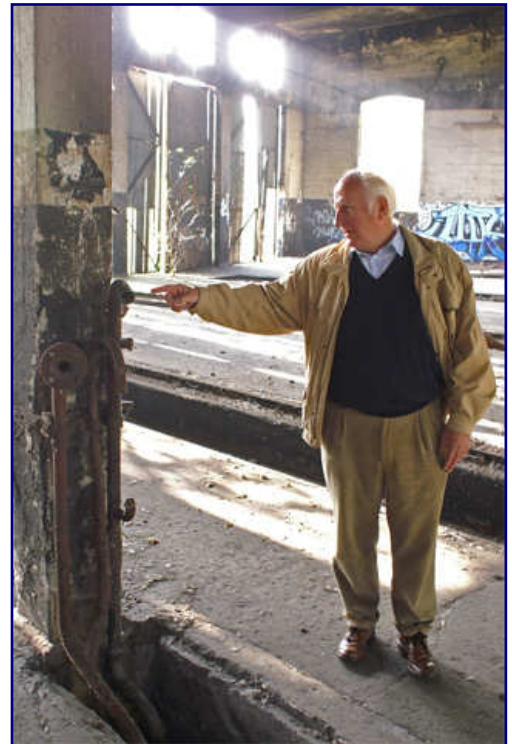
Bei der Lokschuppenbegehung werden die vielen Arbeiten der Dampflokomotive anschaulich erläutert.