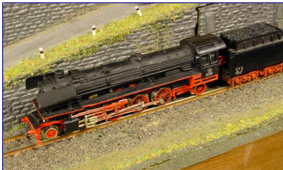
Die rot lackierte Führerhausabstützung (Vorderkante des Einheitsführerhauses) und die hintere Nachbildung des Rahmens sind aus dieser Perspektive gut zu erkennen.

Ein winziges Detail hat Jens Wimmel bei seiner Lok allerdings nicht bedacht: Das linke Windleitblech (Heizerseite) hat etwa mittig an seiner Unterseite einen kleinen Ausschnitt. Beim Vorbild sitzt an dieser Stelle auf dem Umlauf die Speisepumpe, für die der Ausschnitt erforderlich ist. Eine Speisepumpe ließe sich einzeln bei Märklin beziehen (Ersatzteilnummer 263 850) und würde eine Rechtfertigung für die Nachbildung liefern – also ruhig Mut zur Lücke!