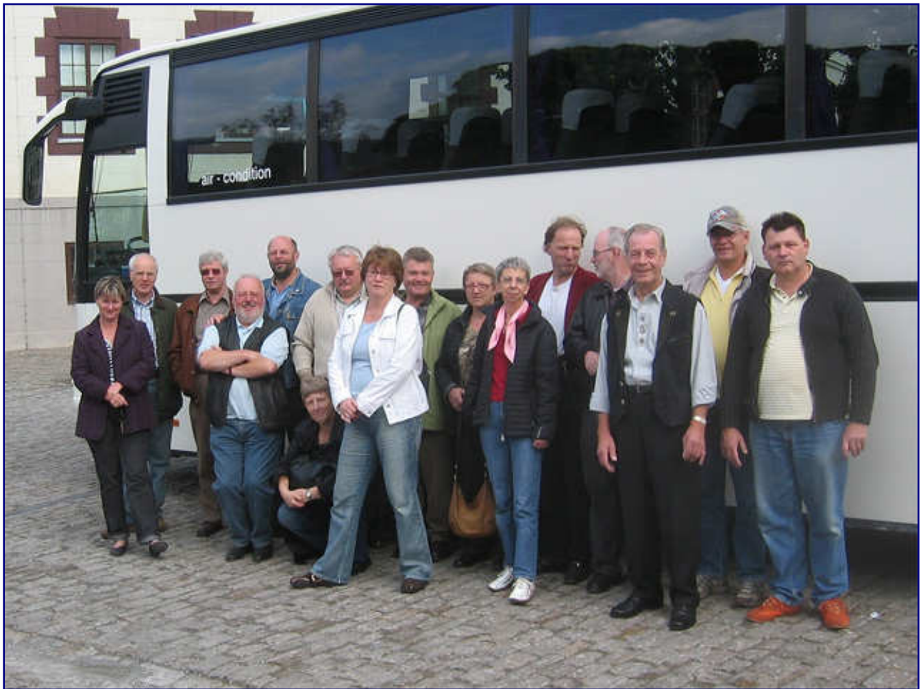
Gruppenbild mit Dame(n): Gemeinsame Ausflüge gehören alljährlich zum Programm beim Stammtisch Untereschbach e.V. Im Jahr 2007 ging es mit dem Bus zum Dampfklopfest nach Meiningen.

Weitere Aktivitäten unseres Stammtisches sind Feiern und Ausflüge. Jedes Jahr wird ein Sommergrillfest in unserer „Museumsniederlassung“ gefeiert. Seit 1997 veranstalten wir jährlich auch noch eine „Fahrt ins Blaue“ - ein echter Überraschungsausflug. Einer dieser Ausflüge fand z. B. in einem Straßenbahnwagen der Kölner Verkehrsbetriebe statt. Er ermöglichte den Mitgliedern des Stammtisch Untereschbach das Erkunden des Kölner Straßenbahnnetzes in gemütlicher Runde. Ohne lästige Unterbrechungen an Haltestellen wurde dabei natürlich auch das eine oder andere Kölsch genossen.