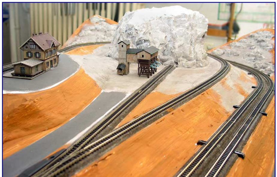
Bild oben: Ansicht des Rohbaus der L-Anlage. Einige Spanten sind noch sichtbar. Fliegendraht gibt einen Eindruck von der künftigen Geländestructur.

Beim Gleismaterial wird auf das Märklin-Sortiment zurückgegriffen, bevorzugter Zubehörhersteller ist Faller, von denen die Korkgleisbettungen, Modellwasser und viele Gebäude stammen. Für eine vorbildnahe Optik sorgen patinierte Gleise und Gebäude.