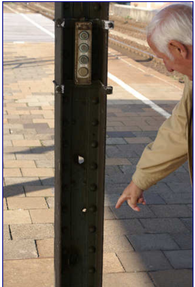
Unterwegs mit einem Lokführer: In den Bahnhöfen ist er praktisch zu Hause. Hier zeigt er alte, bis heute sichtbare Kriegsschäden im Bahnhof Rheine, vermutlich aus Tieffliegerbeschuss.

Trainini: Wie wirkt denn die moderne, privatisierte Bahn auf Sie? Kann dieses Unternehmen Sie noch begeistern oder ist das aus Ihrer Sicht kalt oder anonym?